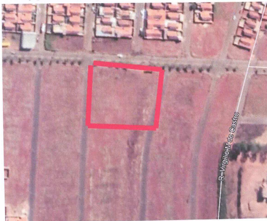
Figura 12 – Praça Jardim Esperança