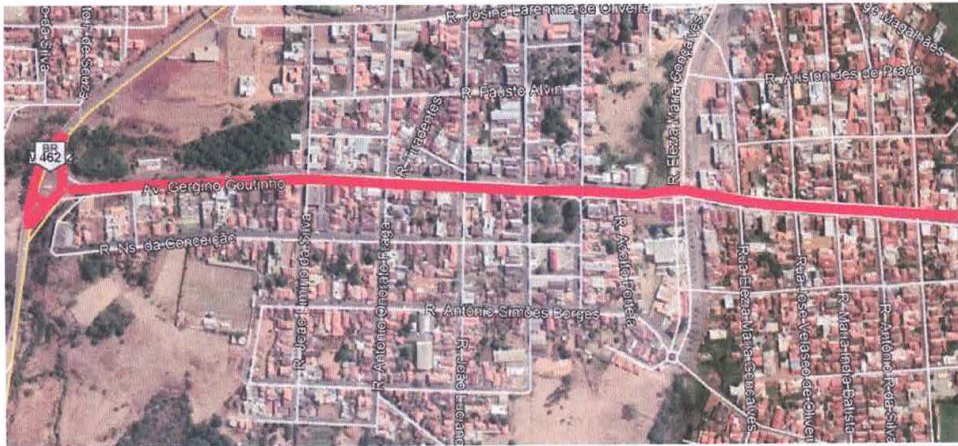
Figura 14 – Avenida Gercino Coutinho