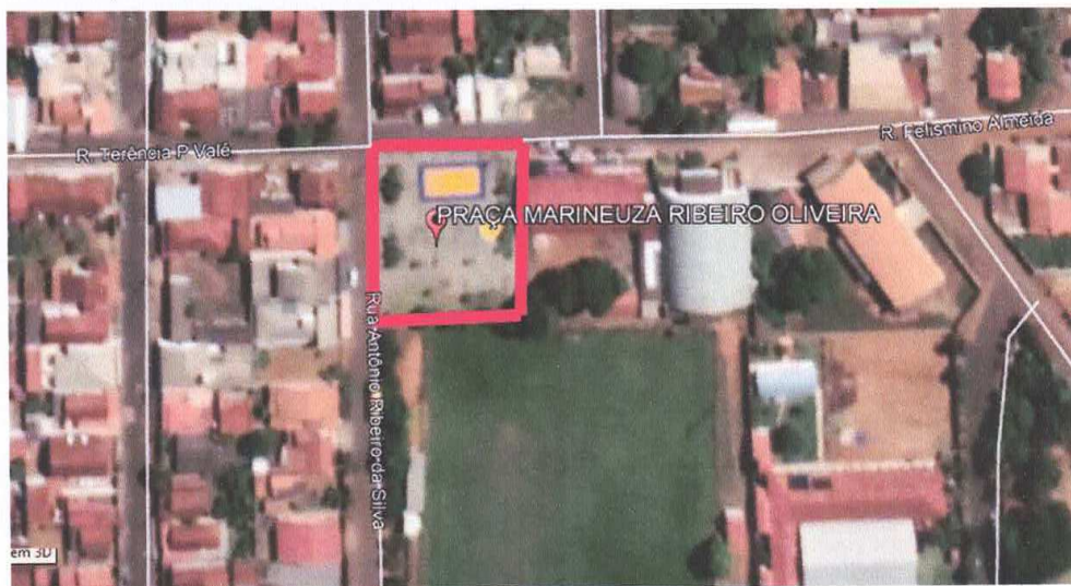
Figura 9 – Praça Marineuza Ribeiro Oliveira