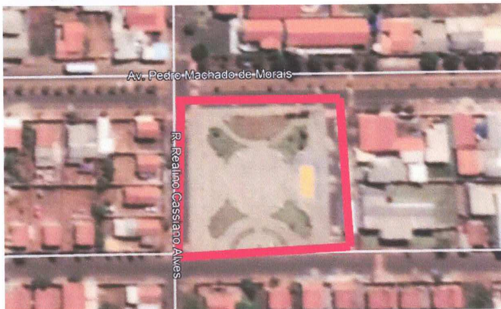
Figura 13 – Praça Morada Nova