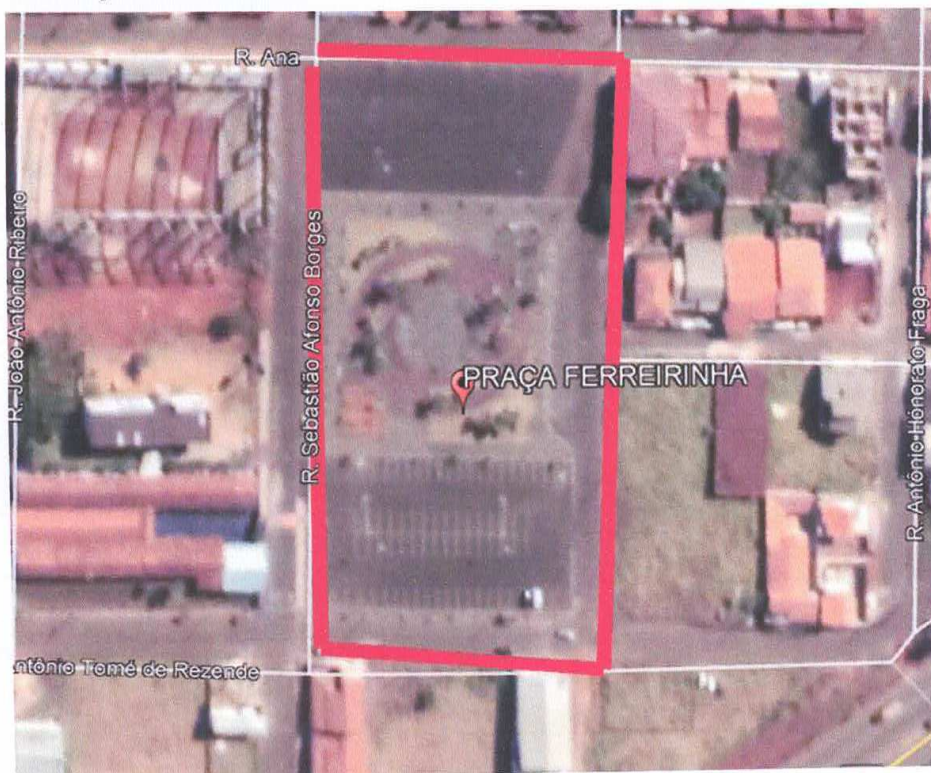
Figura 11 – Praça Ferreirinha