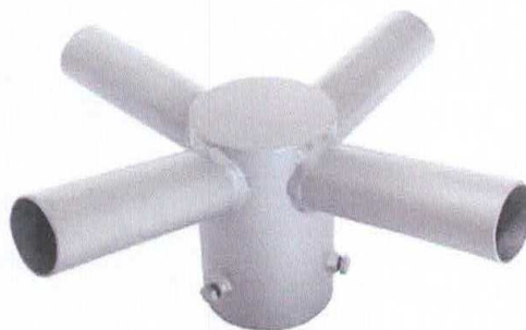
Figura 3 – Suporte para 04 Elementos, para topo de poste de concreto

NÚCLEO GALVANIZADO DE 04 ELEMENTOS, TUBO CENTRAL DE 6", ESPESSURA MÍNIMA 3,0mm, COM PARAFUSOS DE FIXAÇÃO DE 45mm DE COMPRIMENTO MÍNIMO, COM 04 BRAÇOS DE 250mm X 60,3mm, ESPESSURA MÍNIMA 2,25mm, PARA A FIXAÇÃO DE LUMINÁRIAS, COM INCLINAÇÃO DE 15° COM O EIXO HORIZONTAL. CONJUNTO REVESTIDO COM ZINCO POR IMERSÃO A QUENTE CONFORME NBR 6323/90.