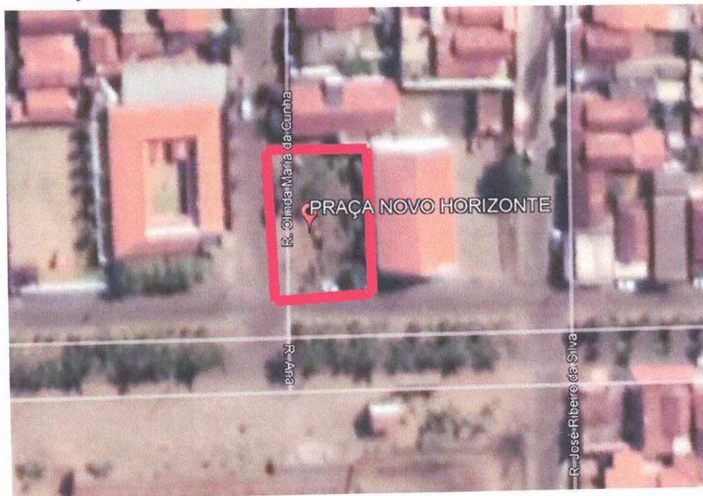
Figura 10 – Praça Novo Horizonte