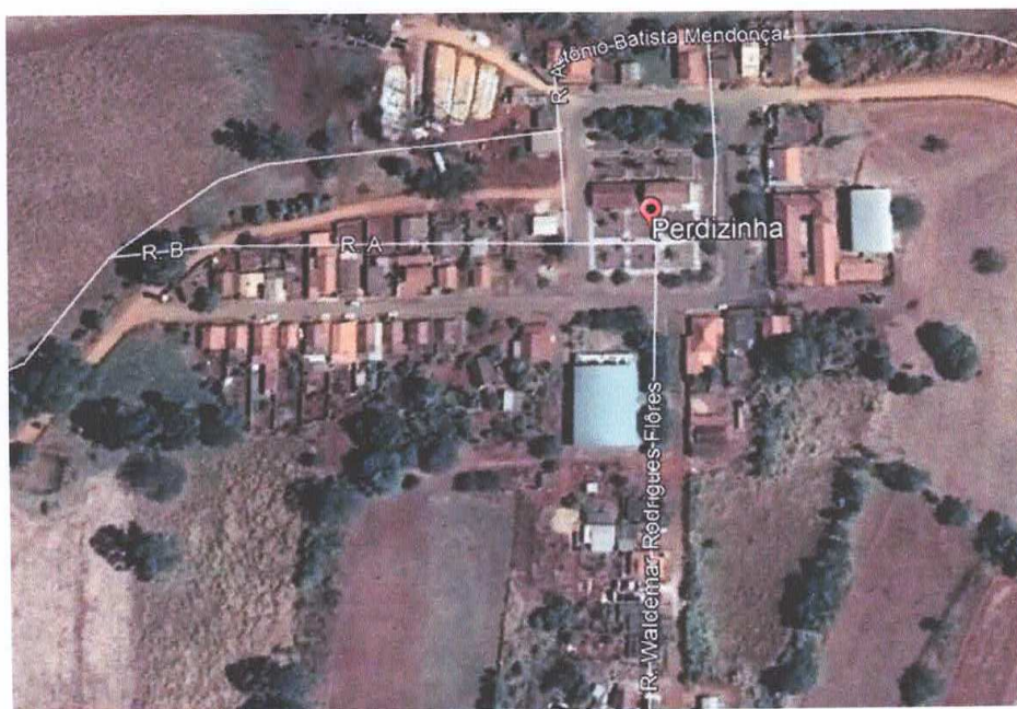
Figura 15 – Praça do Distrito de Perdizinha