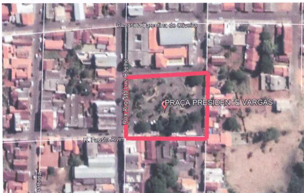
Figura 8 – Praça Presidente Vargas