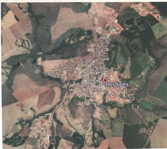
Figura 1 – PERDIZES-MG