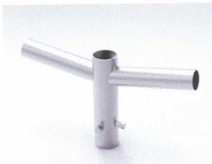
Figura 5 – Suporte para 02 Elementos, para topo de poste metálico

NÚCLEO GALVANIZADO DE 02 ELEMENTOS, TUBO CENTRAL DE 4,1/2", ESPESSURA MÍNIMA 3,0mm, COM PARAFUSOS DE FIXAÇÃO DE 45mm DE COMPRIMENTO MÍNIMO, COM 02 BRAÇOS DE 250mm X 60,3mm, ESPESSURA MÍNIMA 2,25mm, PARA A FIXAÇÃO DE LUMINÁRIAS, COM INCLINAÇÃO DE 15° COM O EIXO HORIZONTAL. CONJUNTO REVESTIDO COM ZINCO POR IMERSÃO A QUENTE CONFORME NBR 6323/90.