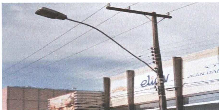
Figura 2 – Braço Convencional existente