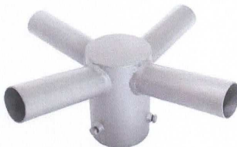
Figura 4 – Suporte para 04 Elementos, para topo de poste metálico

NÚCLEO GALVANIZADO DE 04 ELEMENTOS, TUBO CENTRAL DE 4,1/2", ESPESSURA MÍNIMA 3,0mm, COM PARAFUSOS DE FIXAÇÃO DE 45mm DE COMPRIMENTO MÍNIMO, COM 04 BRAÇOS DE 250mm X 60,3mm, ESPESSURA MÍNIMA 2,25mm, PARA A FIXAÇÃO DE LUMINÁRIAS, COM INCLINAÇÃO DE 15° COM O EIXO HORIZONTAL. CONJUNTO REVESTIDO COM ZINCO POR IMERSÃO A QUENTE CONFORME NBR 6323/90.